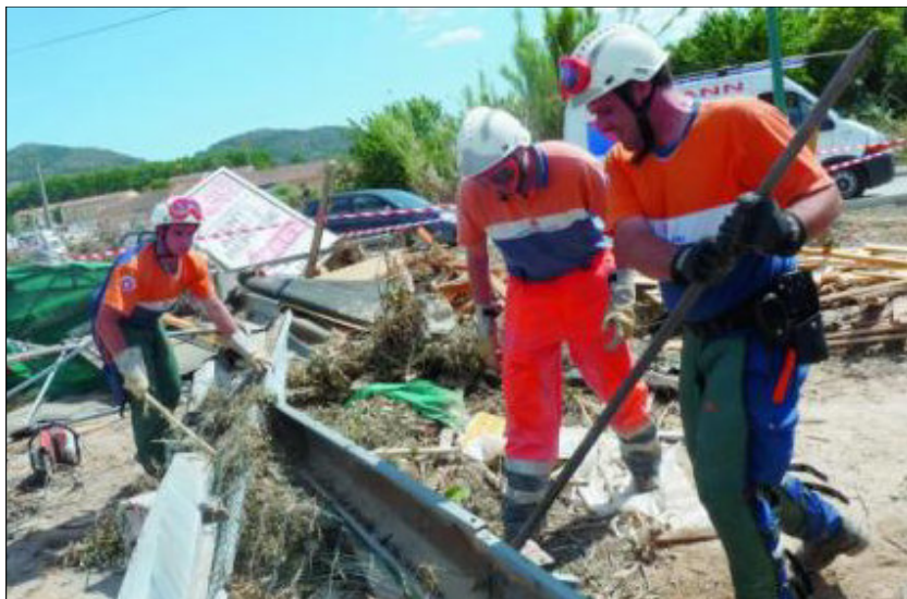
Au Muy, les bénévoles de la Protection civile interviennent sur la route où des glissières ont été emportées.