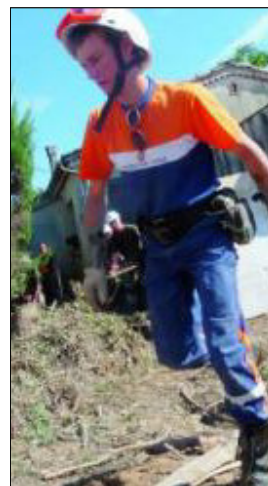
A Taradeau, à proximité de la Florièvre.